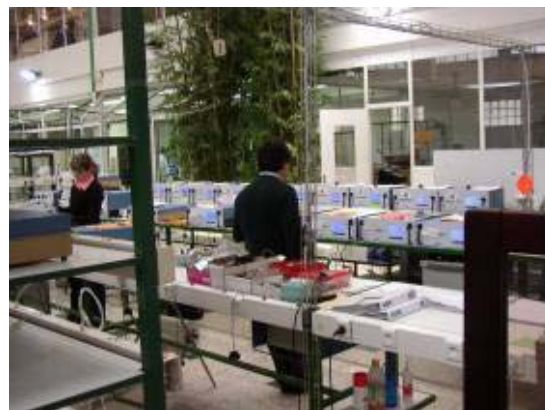
最終出荷検査場の風景

講堂のように広く明るい 3 階建て主棟の大半は、部品資材置き場、組み立て部門、修理 / 調整 / 校正 / 最終検査の区画が占め、迷いそうになる。開発部門以外は立ち入り可能だった。そこそこに製造中の製品がある。流れ作業ではなく各人が担当区画を持っており、組み立て専門で何十年という技術者が、私服で自由に動いている。職人気質は健在のようだ。