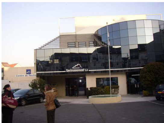
エンバイロメント S.A 本社ビル

エンバイロメント S.A 社は、資本金 65 億円、海外支部を含めて約 200 名の従業員から成り、2007 年の総売上は約 70 億円。主市場の欧州から、中近東、東アジアなど 65 ヶ国に販路を持つ。総売上の約 70% を海外輸出で得ており、中国やインドなど過熱するアジア市場での販路拡大にもしのぎを削っている。日本市場も対象外ではなく、この度のグリーンブルーとエンバイロメント S.A との代理店契約締結を機に、今回訪問した訳である。