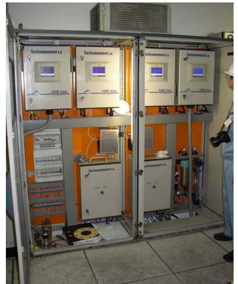
清掃工場に設置された MIR 9000 の監視装置 各ラインがデュアル(2重)で測定されている

パリ近郊の清掃工場で MIR 9000 の稼働を実地見学し、1 週間の濃密な研修を終えた。ただ、知識整理に追われて外に出回ることができなかったのは、自分としては残念無念の目算外れとなった。