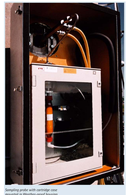
Sampling probe with cartridge case mounted in Weather-proof housing

家庭から出されるプラスチックごみ(廃プラスチック)は、容器リサイクル法の関係から分別してリサイクルにまわし、残りを埋め立て処分にしていました。ところが東京都のごみを扱う清掃一部事務組合は、